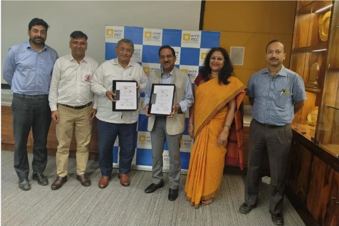
REC Limited commits Rs. 15 Crore for free medical treatment

Gurugram: In a significant Corporate Social Responsibility (CSR) initiative, REC Limited, a Maharatna CPSE under the Ministry of Power and a leading NBFC, has committed Rs.15 crore to provide free medical treatment and surgery for approximately 1,000 children born with congenital heart disease from economically weaker sections of society.