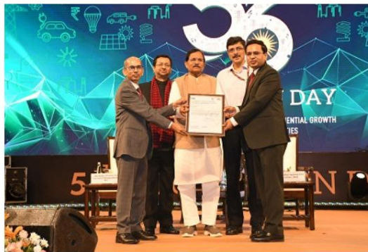
REC first Indian Public Sector NBFC to achieve ISO certification