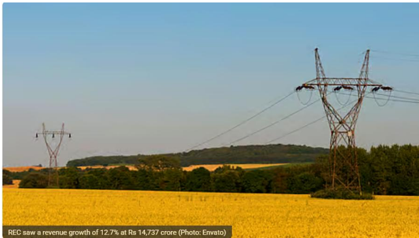
REC saw a revenue growth of 12.7% at Rs 14,737 crore

REC Q1 Results: The firm posted a bottom-line of Rs 4,446 crore in comparison to Rs 3,460 crore in the year-ago period.