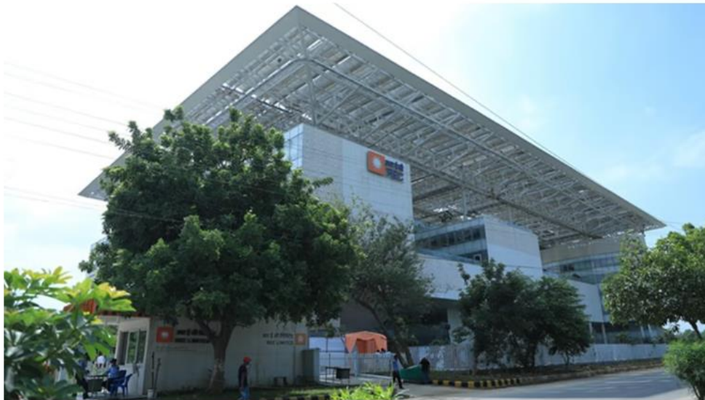
REC signs Rs 3 lakh crore financing agreement with Rajasthan Govt for power projects

REC Limited on Tuesday said it has signed an agreement with the Rajasthan government to provide financing of Rs 3 lakh crore for power projects