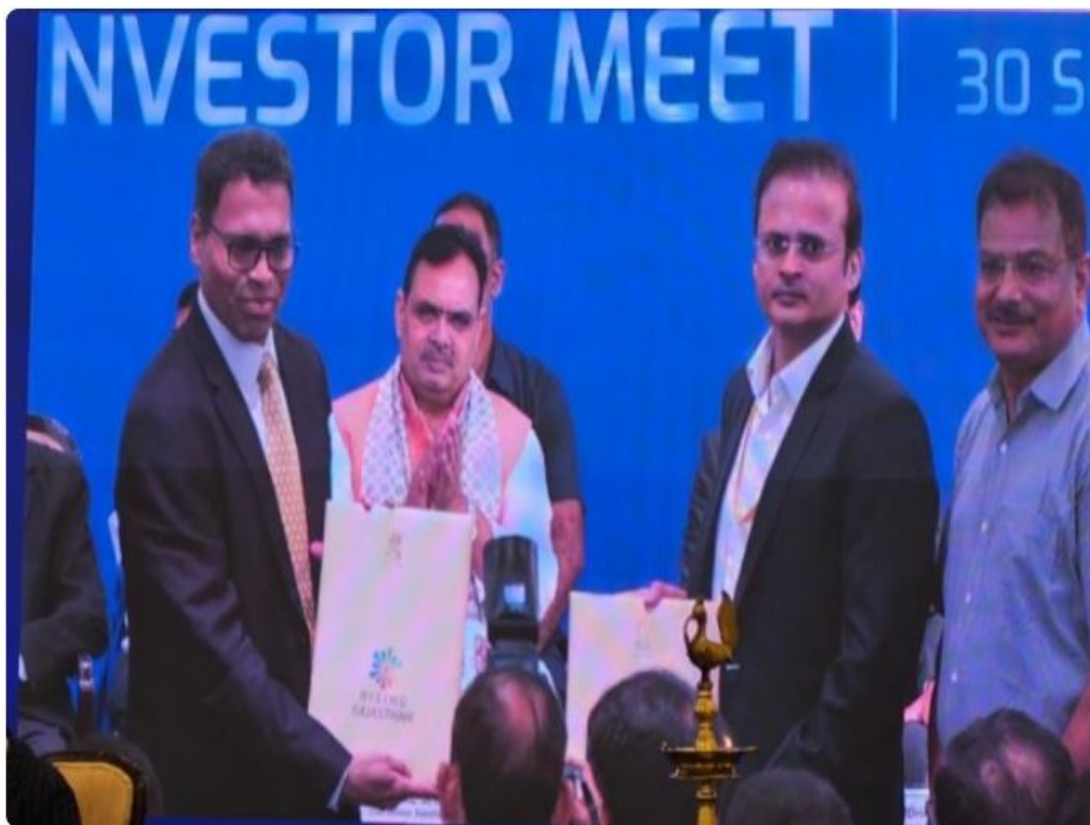
Rajasthan CM Bhajan Lal Sharma with REC limited officials