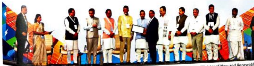
Shri Vivek Kumar Dewangan, IAS, CMD, REC receiving Shapath Patra from Shri Pralhad Joshi, Hon'ble Union Minister of New and Renewable Energy during RE-INVEST 2024 in Gandhinagar, Gujarat.

INVEST IN RENEWABLE ENERGY INVEST IN A CLEANER FUTURE