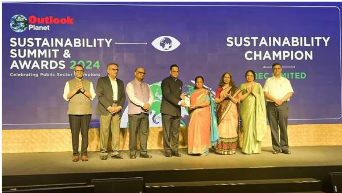
REC wins 'Sustainability Champion – Editor's Choice Award'

This award recognises REC's commitment to sustainability initiatives and its efforts in driving progress towards a greener future