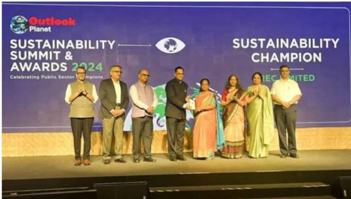
The award ceremony, organized by the Outlook Group in collaboration with IIT Goa, recognizes REC's commitment to sustainability and its contributions towards a greener future.

Devdiscourse News Desk | Goa | Updated: 29-05-2024 16:28 IST | Created: 29-05-2024 16:28 IST